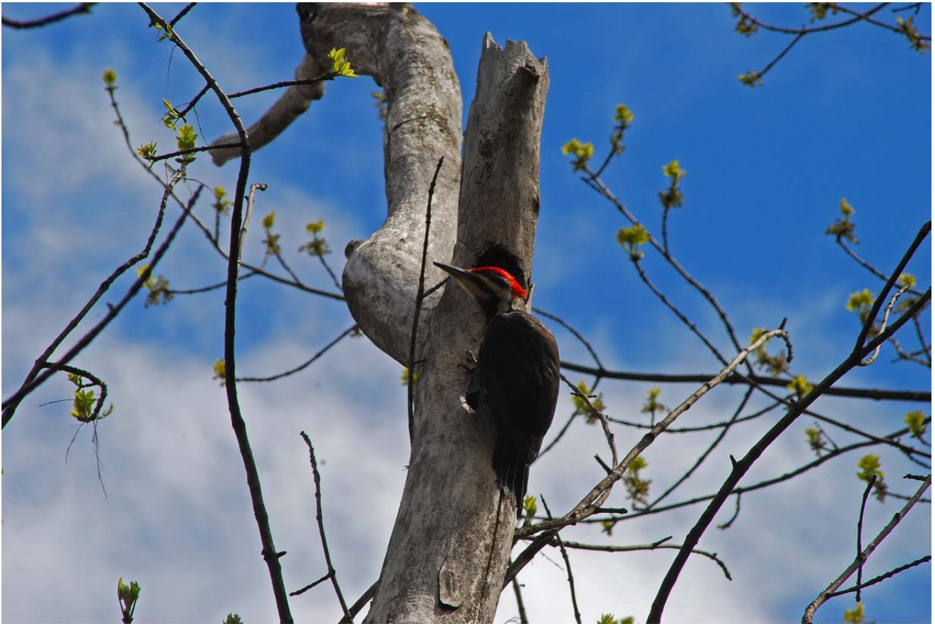
Grand Pic, Cimetière de Laval

PAR BENOÎT GOYETTE, LISE DE LONGCHAMP, RHÉAL BÉLANGER