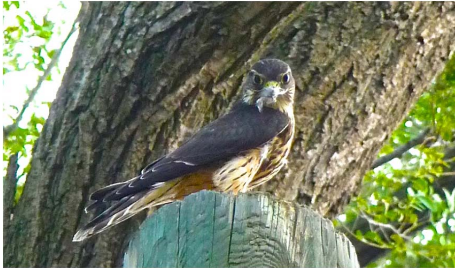
Crécerelle d'Amérique ( Benoît Goyette )

Dès le début et tout au long du sentier, nous rencontrons à peu près les mêmes espèces déjà vues au site précédent et il s'en ajoute de nouvelles comme des sittelles, merles et quiscales (dont un rouilleux !) qui font leurs vocalises du matin, pour la plupart. Nous aurons également le plaisir de voir un Pic maculé et un Vacher à tête brune, en plus d'un superbe Pic flamboyant qui reluit de tous ses feux, sous le soleil matinal.