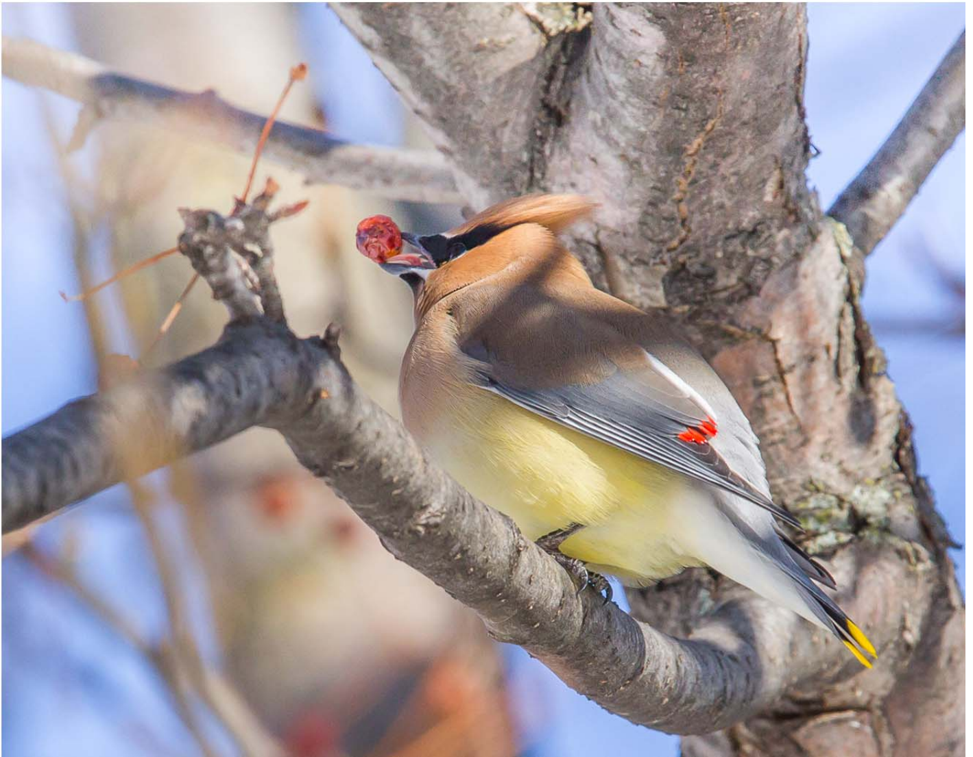
Jaseur d'Amérique