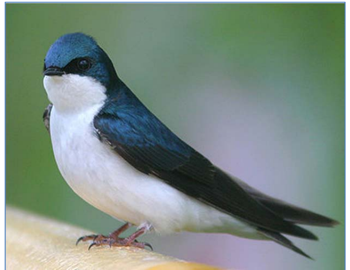
Hirondelle bicolore

Ces beaux oiseaux mesurent de 12 à 23 cm et pèsent autour de 10 à 50 g. Ils ont un profil très aérodynamique à la queue plus ou moins fourchue et aux longues ailes pointues. Pour leurs chants, on dit qu'elles trissent ou gazouillent. Les espèces qui habitent surtout en Amérique du Nord sur les côtes américaines du Pacifique et de l'Atlantique ont leur zone d'hivernage dans les Caraïbes et dans les régions côtières de l'Amérique centrale. La présence de nombreux espaces boisés et plans d'eau semblent des facteurs favorables pour leur habitat.