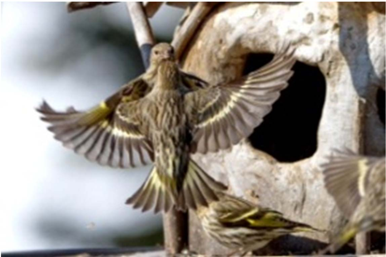
Tarins des pins, Saint-Ambroise de Kildare, 2016

Au nom des membres du club, merci Denyse !