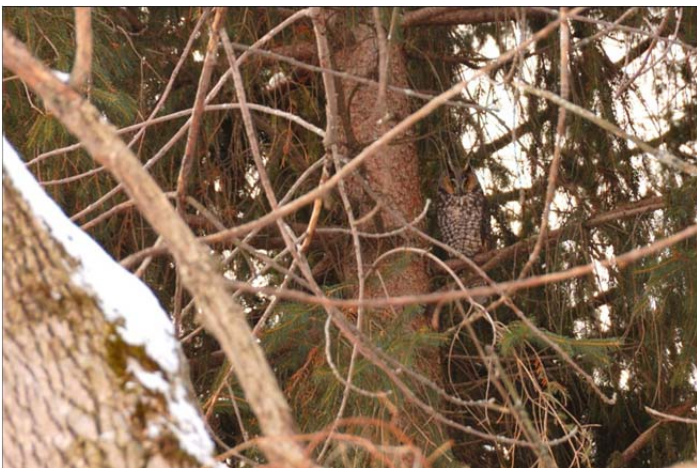
Hibou moyen-duc, Pointe-aux-Prairies