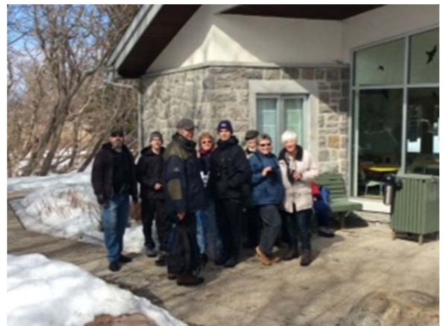
Sortie du 12 mars 2016, Pointe-aux-Prairies