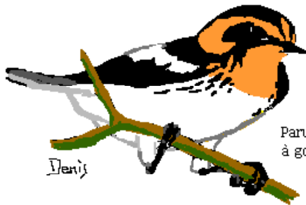
Paruline à gorge orangée